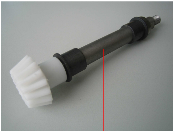
Schneckenradwelle mit aufgeschrumpftem Kunststoff-Kegelrad